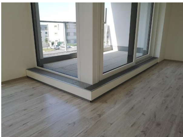
Energitech FOX STEP