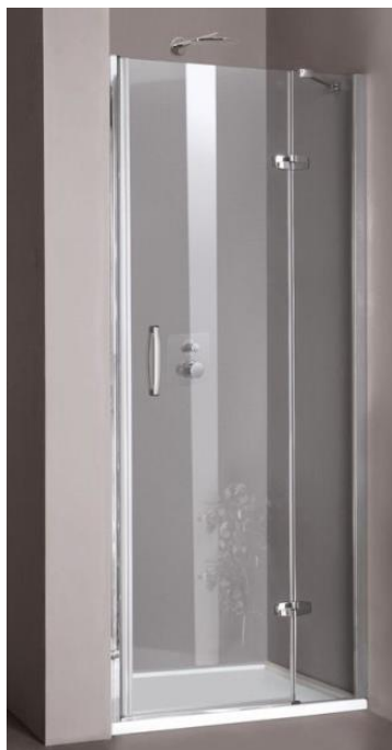
Zástěna sprchová – nika, dveře jednokřídlé s pevným segmentem