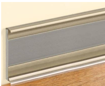
Soklová lišta Bolta 0880